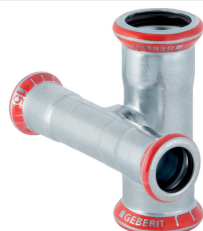
Imagen de ejemplo